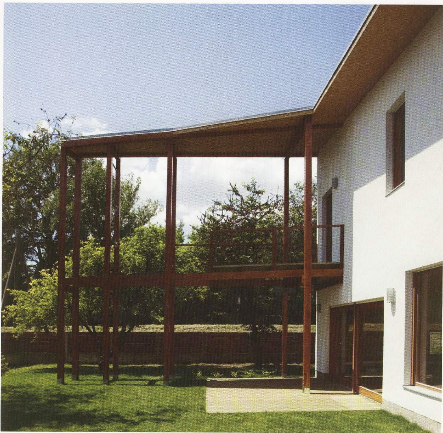
A házhoz kapcsolódó teraszos pergolán futónövények alkotnak majd élő függőnyt - lezárva a kis, U alakú udvart

Bár a folyót itt magas töltés rekeszti el, az élénken zöldellő, dús növényzet és a víz illata mégis jelzi a közelségét. Dél felé nagy tisztás tárul elénk, a távolban végtelen fasorok. A ház csak lassan fedi fel teljes valóját: elsőre szinte a végletekig visszafogott formálású, szikár épületnek mutatja magát. E különös látványt a homlokzatok elé épült fastruktúrák derékszögei, éles függőleges vonalai is fokozzák. A falak, szerkezeti kapcsolatok, színek, felületek