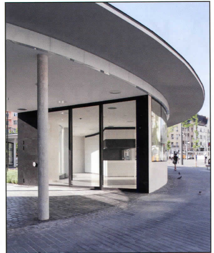
A pavilon karakterét a körbefutó tető adja

Az összkép szempontjából szintén problémás az a kakofónia, ami a téren tapasztalható. Az elmúlt évtizedek építési beavatkozásai nem jó ütemben és nem kellő összehangolással valósultak meg. Többféle épület, támfal,