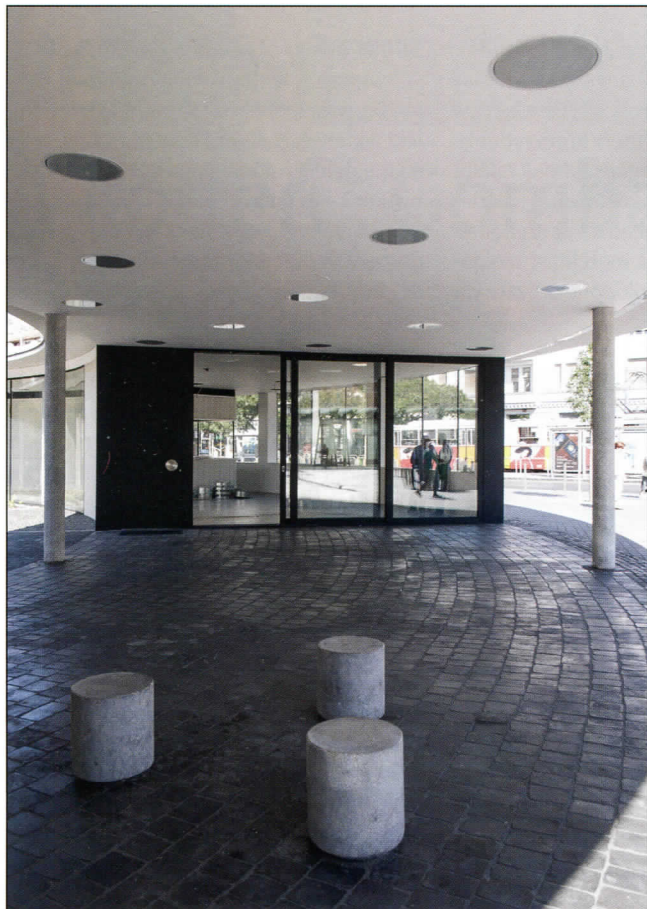
A gomba kalapja alatt: áthaladás, eső elől menedék, találkozó pont