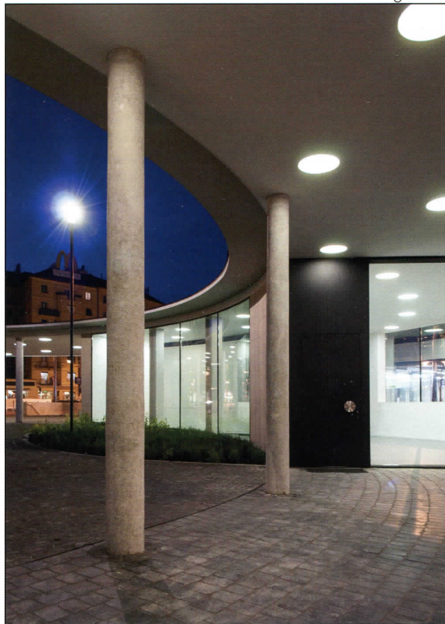
Átjárások és átlátások: az építészeti felvetés lényege